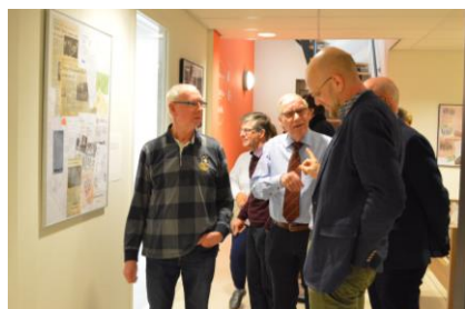
expositie regionale Rabobanken

Het Erfgoedcentrum gaat zich meer profileren en zijn naam vestigen als kennis- en informatiecentrum op het gebied van de regionale identiteit. Daar zijn extra middelen voor nodig naast de bijdragen van de aangesloten gemeenten. Om die te genereren moet worden ingezet op de relatie met donateurs en 'Vrienden' en moeten sponsors betrokken worden bij activiteiten. Van belang is ook de bijdrage vanuit de provincie Gelderland. Een financiële bijdrage door de provincie is toegezegd tot en met 2020, er zijn geen toezeggingen voor de jaren daarna. Uit de ondertekening van het convenant tussen Rijk en provincies m.b.t. formele erkenning van het Nedersaksisch vloeit echter wel een 'verplichting' voort om dit in de betreffende provincie permanent te ondersteunen. Hier moet door het Erfgoedcentrum bij de provincie Gelderland op worden ingezet.