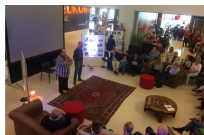
voorstelling Open Monumentendag

Om de regionale identiteit onder de aandacht te brengen en te houden onder een breed publiek en mensen aan zich te binden organiseert het Erfgoedcentrum verschillende vaste en eenmalige activiteiten. Deze zijn gericht op diverse doelgroepen en behelzen diverse thema's. Dit kan variëren van het geven van rondleidingen en lezingen, het organiseren van exposities, filmavonden en het streektaaldictee tot het deelnemen aan Open Monumentendag en de Maand van de Geschiedenis.